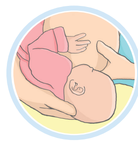
Pozycja spod pachy